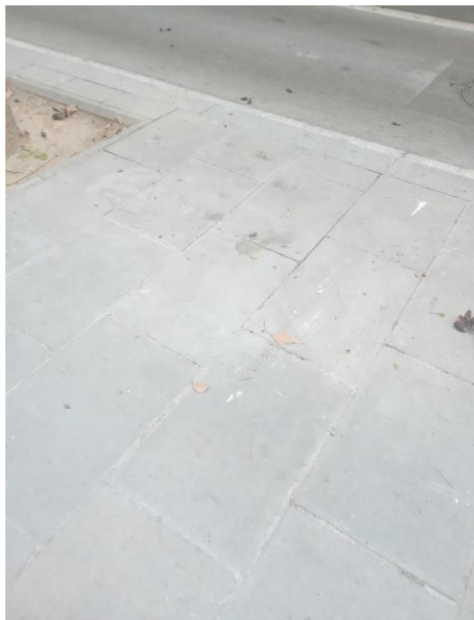
Zona de vianants/casc antic (Foto 1)